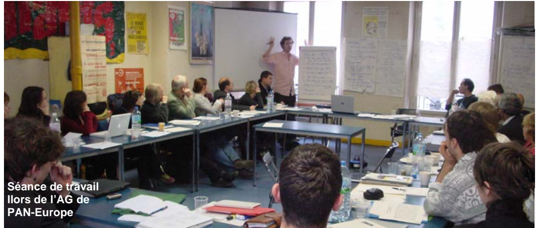
Séance de travail Ilors de l'AG de PAN-Europe

Chaque année PAN-Europe, Pesticides Action Network, se réunit pour son assemblée générale (AG). Cette fois, il revenait au MDRGF, en tant qu'administrateur français du réseau, d'organiser ce rendez-vous. L'AG s'est donc tenue à Paris. Des ONG de toute l'Europe se sont retrouvées pour échanger sur les pesticides faisant un bilan et réfléchissant aux actions à mener. Le 1 er jour le MDRGF a présenté les résultats du Grenelle et de son action. Nos partenaires européens sont ravis des résultats présentés. Cette mesure est pour eux l'occasion de faire pression dans leur pays