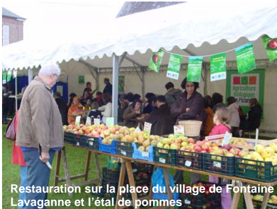
Restauration sur la place du village de Fontaine Lavaganne et l'étal de pommes