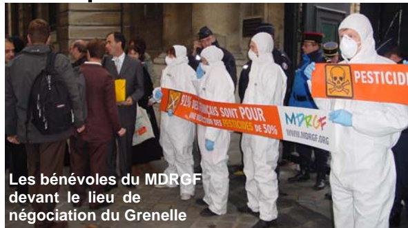
Les bénévoles du MDRGF devant le lieu de négociation du Grenelle

Lors des deux jours de négociation finale, soit les 24 et 25 octobre, le MDRGF n'a pas relâché la pression et a manifesté avec ses bénévoles devant le MEDAD. Ainsi, juste avant la réunion traitant de la santé environnementale, une dizaine de bénévoles ont déployé devant le lieu des négociations une banderole présentant les résultats d'un sondage montrant que la première préoccupation des français en matière d'environnement était la réduction de l'utilisation des pesticides. Au vu des résultats, on peut penser que leurs attentes ont commencé à être prise en considération.