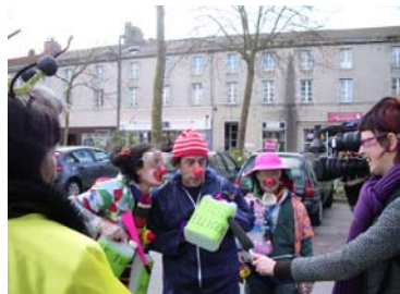
Action LPO Vendée, les Greenpitres, le 22 mars

Infos. Retrouvez le bilan complet sur semaine-sans-pesticides.fr