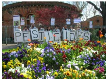
Manifestation du CAPAT à Toulouse le 20 mars

Dans le cadre de la 3ème Semaine pour les Alternatives aux pesticides (SSP) ont eu lieu plus de 40 conférences, autant de projections suivies de débats, de nombreuses expositions, animations et spectacles, des visites et portes ouvertes en jardins ou exploitations agricoles ou bien des actions citoyennes telles que des enquêtes ou des Chartes engageants des magasins, des jardiniers ou des collectivités vers le 0 pesticide.